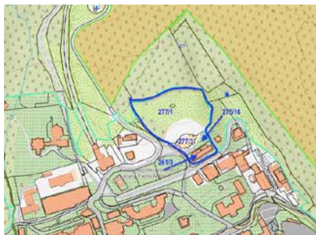
Starý Smokovec – pozemky zadání